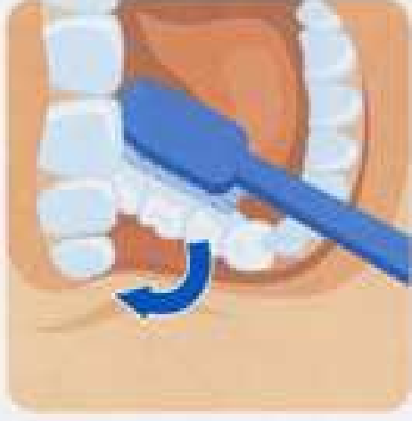
2. Внутренние поверхности зубов