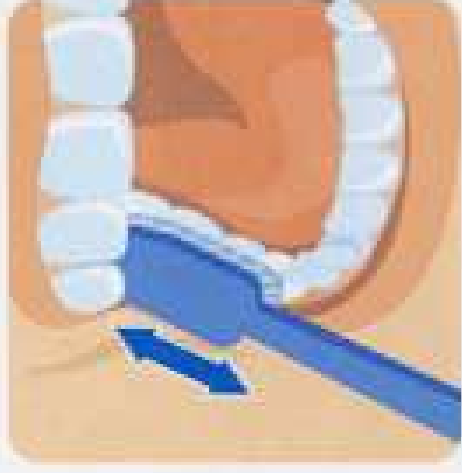
4. Жевательная поверхность зубов